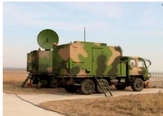
图 2 地面站部署画面