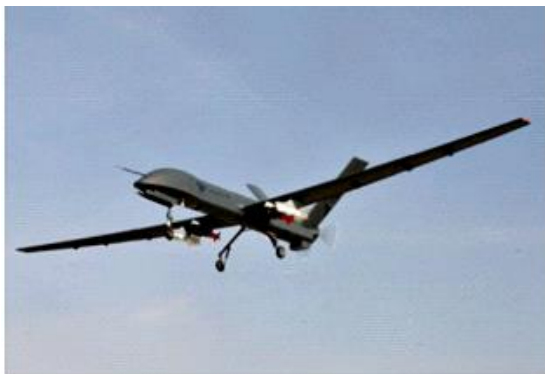
图 1 无人机飞行画面

3) 可以同时搭载光电设备和小型非致命性空地武器，对动乱区域进行长时间的侦察监视，在必要的时候，可以投放或发射非致命性空地武器，让犯罪分子失去犯罪能力，避免造成更大的损失，便于警察对犯罪分子的抓捕；也可以投放或发射致命性空地武器，对恐怖分子予以定点清除。